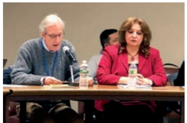
Commission pour le développement social, février 3, 2018