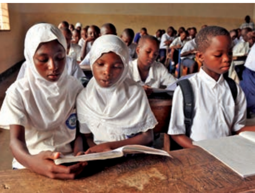
Dar Es Salaam, Tanzanie – Un des organisateurs du projet Éducation pour tous a dit de celui-ci : « Il existe à présent

plus de solidarité entre les personnes vivant en situation de pauvreté et les enseignants, les autorités locales et les autres partenaires du système éducatif. [...] Grâce à cette collaboration, les enfants ont fini par considérer l'école comme un lieu où ils se sentent bien ». Comme conclusion au projet, ATD a organisé le séminaire « Access to Primary School Education for Children Living in Extreme Poverty » (Accès à l'école primaire pour les enfants en situation de misère), présentant les activités du projet dans 14 écoles participantes. Cela a rassemblé des professeurs, des personnels de l'éducation et des parents qui ont contribué à changer l'école grâce aux recommandations du projet, ainsi que des représentants de diverses organisations et d'autres partenaires de l'éducation. Les participants ont conclu qu'une implication à parts égales de la part de tous est importante pour pouvoir assurer la réussite scolaire des enfants. Dans une école primaire, comme résultat de ce projet, les enfants les plus pauvres, qui ne sont pas en mesure d'apporter de la nourriture à la cantine, sont aidés par les familles qui peuvent contribuer plus. Cela permet que personne ne soit exclu des repas scolaires.