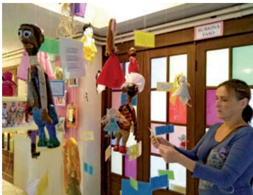
Tapori : Exposition de marionnettes avec messages d'amitié, installée au centre international d'ATD Quart Monde à Méry-sur-Oise, en France

Après une année festive pour célébrer son 50 e anniversaire, Tapori s'est recentré sur le travail quotidien : bâtir des liens entre les enfants de différents milieux, partager leur courage et soutenir ceux qui s'engagent à leurs côtés dans différents pays du monde. En octobre, le secrétariat Tapori a présenté une exposition de marionnettes avec leurs messages d'amitié, pour les visiteurs d'ATD et les écoles primaires de la ville du Méry-sur-Oise, au centre international d'ATD.