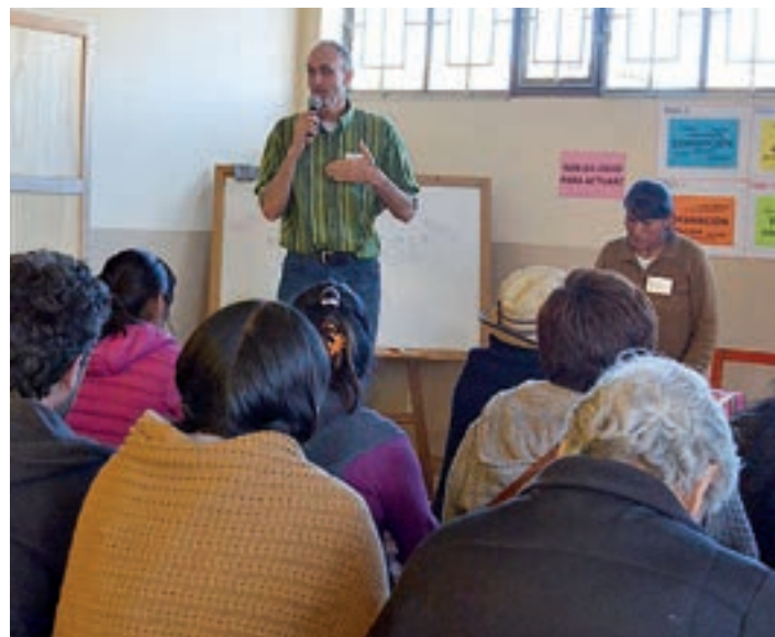
Université Populaire Quart Monde, novembre 2018, El Alto, Bolivie

El Alto, Bolivie – « Les lois ne sont pas faites pour ceux qui ont peu de moyens. » L'université populaire Quart Monde de ce mois-ci était focalisée sur les difficultés avec le système judiciaire que rencontrent beaucoup de familles boliviennes au quotidien. Avant la rencontre, des discussions préparatoires ont eu lieu sur les sujets suivants : corruption, diffamation, ainsi que les attitudes négatives et le manque de considération de la police et du système judiciaire en général. Plus de 40 participants et un avocat invité ont dialogué à propos des outils qui permettraient à la justice de mieux traiter les individus et de manière plus juste. La rencontre a encouragé les personnes à continuer de réfléchir sur ces sujets et à participer à des discussions qui aident les personnes à prendre conscience que leurs connaissances valent la peine d'être partagées, en particulier pour celles vivant en situation d'extrême pauvreté.