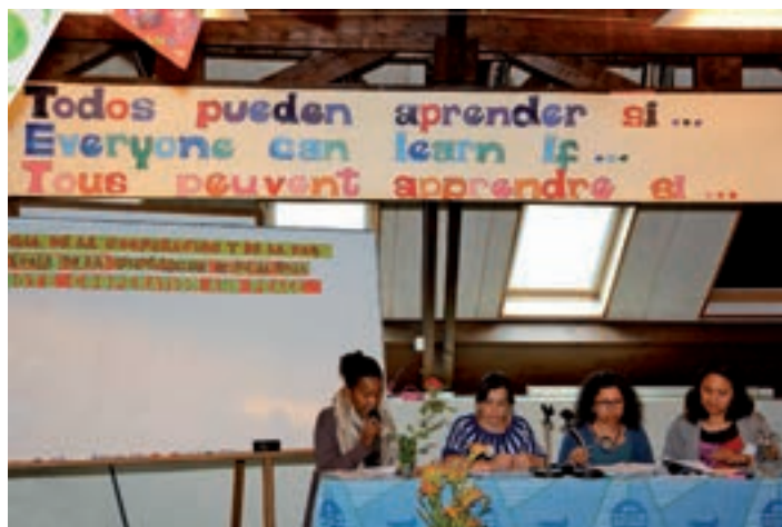
Séminaire sur l'éducation, du 10 au 16 juin, 2018, Pierrelaye, France

Budapest, Hongrie – ATD a organisé une rencontre de trois jours en cinq langues différentes, au Centre européen de la jeunesse à Budapest. Le but était de créer des liens entre des personnes de différentes régions et de divers milieux sociaux. Parmi les participants se trouvaient des groupes de Bulgarie, de Hongrie, de Roumanie et de Serbie, des membres d'ATD de Belgique, de France, de Pologne et du Royaume-Uni qui ont vécu dans la pauvreté, tout comme des groupes qui travaillent avec ceux qui sont exclus de la société à cause de la pauvreté. Les participants se sont