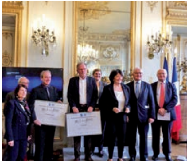
Le 10 décembre 2018. L'Association française pour les Nations Unies à décerné sa mention spéciale 2018 à ATD Quart Monde France

lien entre santé mentale et pauvreté en s'appuyant sur le résultat intermédiaire de la recherche sur les dimensions cachées de la pauvreté auquel participe ATD aux États-Unis. La rencontre s'est conclue par un atelier de « pleine conscience » pour apprendre des techniques de relaxation et créer une atmosphère calme et favorable.