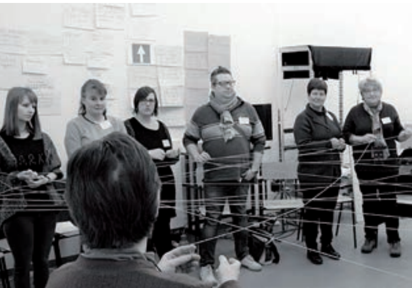
Croisement des savoirs, février 2018, Bruxelles

Bruxelles, Belgique – Une session de 4 jours de Croisement des savoirs diffusée en direct sur internet a été organisée par ATD en Février, suite à la demande du Conseil d'Arrondissement de l'Aide à la Jeunesse. L'événement a rassemblé 23 professionnels, parents militants et animatrices à Dison (Belgique) pour discuter des relations entre les services de protection de l'enfance et les familles en situation de pauvreté et d'exclusion sociale. Un travailleur social a dit : « Nous ne pourrions jamais véritablement comprendre ce que vivent les personnes que nous accompagnons, nous ne traversons pas les mêmes épreuves ». La rencontre a révélé que prendre le temps pour dialoguer et se comprendre est primordial. Un militant a dit : « Si les parents vont bien, l'enfant sera bien. Parce qu'on parle toujours des enfants et on ne s'occupe pas des parents. Si on ne s'occupe pas des parents, ça n'ira jamais, l'enfant se sentira toujours mal. Il est important de s'occuper aussi des parents pour que les enfants soient bien ». Les parents et travailleurs sociaux ont fini par conclure que « protéger les enfants » implique un soutien bienveillant pour tous les membres de la famille.