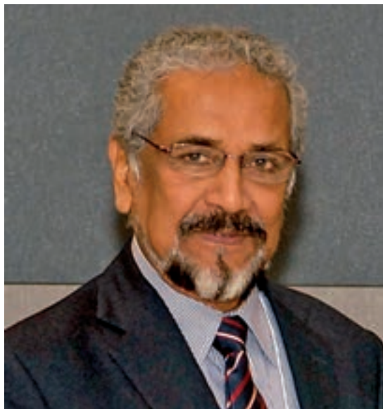
Réunion Comité International 17 octobre - New York, USA mai 2012

Au cours de l'année passée, dans ses actions pour éradiquer la misère et contribuer à la mise en œuvre de l'Agenda 2030 pour le développement durable avec ses 17 Objectifs de développement durable, ATD n'a ménagé aucun effort pour promouvoir le concept de « ne laisser personne de côté » et pour faire entendre avec détermination la voix des personnes vivant dans la misère. En maintenant un dialogue constant avec la communauté internationale, par l'intermédiaire de diverses agences