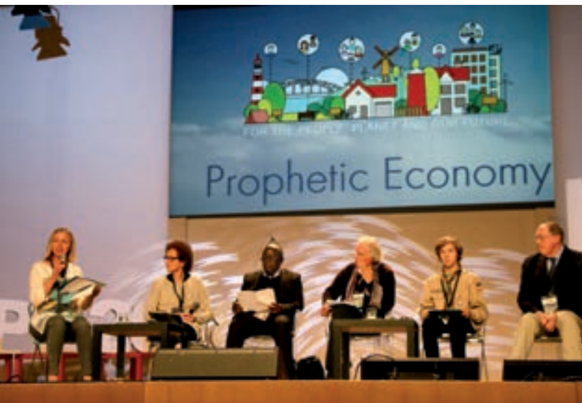
Congrès sur l'Économie Prophétique, Rome, novembre 2018

Rome, Italie – En novembre dernier, une délégation de volontaires d'ATD et de délégués de l'entreprise solidaire Travailler et Apprendre Ensemble (TAE) et l'ONG ECCOFOR (Écouter, Comprendre, Former) a participé au congrès sur l'Économie Prophétique qui a rassemblé 500 personnes de 40 pays des cinq continents pendant trois jours. À travers leur contribution, dont un atelier de 150 personnes, l'équipe d'ATD a mis en avant la nécessité de prendre en compte le point de vue des personnes en situation de pauvreté et d'exclusion dans les initiatives économiques à teneur sociale, solidaire et écologique. Ils ont présenté les projets d'ATD en France (TAE), au Guatemala (TAJ – Trabajar y Aprender Juntos ) et à Madagascar (MMM – Miasa Mianatra Miaraka ) ainsi que les activités d'ECCOFOR. Ces projets faisaient partie des 135 initiatives présentées à l'événement, montrant ainsi des pratiques économiques créatrices de changements conséquents pour aboutir à un développement durable ou une économie où la prospérité est partagée.