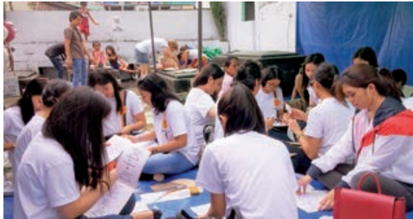
Brigade « Génial », Manille, Philippines, août 2018