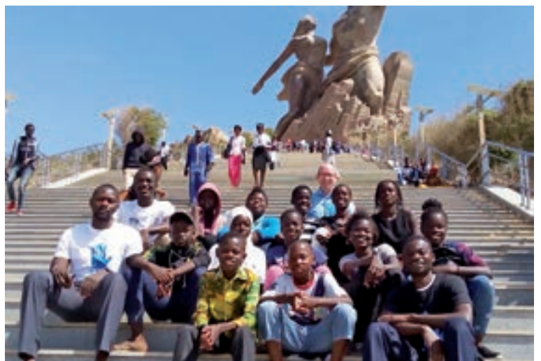
Au monument de la renaissance africaine, mai 2018, Dakar

Dakar, Sénégal – ATD organise des animations appelées « Savoirs dans la rue » ( Xam xam ci Mbeed en wolof), avec des enfants et adolescents dans le quartier de Grand-Yoff à Dakar. Pour les enfants de 4 à 11 ans, les activités tournaient autour des livres et du coloriage. Pour les 12-18 ans, les activités ont inclus la peinture et des débats autour des textes de Joseph Wresinski. Le groupe de jeunes a eu l'opportunité de présenter ses réalisations artistiques à l'occasion de la « Biennale internationale des mômes », événement qui a eu lieu en mai au monument de la renaissance africaine. L'endroit a une grande valeur symbolique, représentant l'autodétermination du peuple africain après l'époque coloniale.