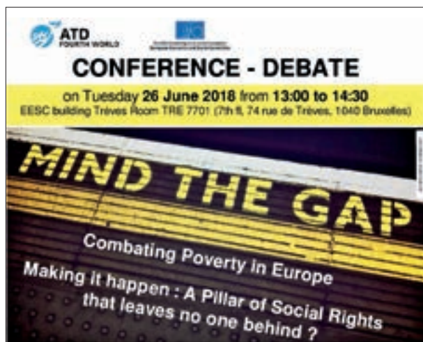
Conférence-débat : Combating Poverty in Europe, le 26 juin 2018, Bruxelles