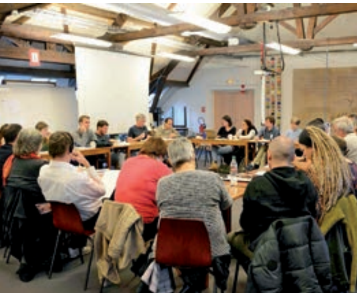
Rassemblement de la jeunesse européenne, janvier 2018, France

Centre International – Les jeunes engagés dans la lutte contre la pauvreté ont participé à un séminaire de formation du 13 au 17 Janvier. Les 40 participants de différents pays européens ont partagé expériences et leçons apprises lors de projets avec des jeunes, afin de trouver des méthodes efficaces de mener des activités dans lesquelles ceux-ci peuvent participer. Le Théâtre-forum est apparu comme un des outils de référence d'ATD dans la motivation des jeunes à travailler pour une société plus juste. Cette méthode aide les jeunes à prendre du recul sur des situations difficiles qu'ils ont vécues et à trouver des solutions ensemble avec le public.