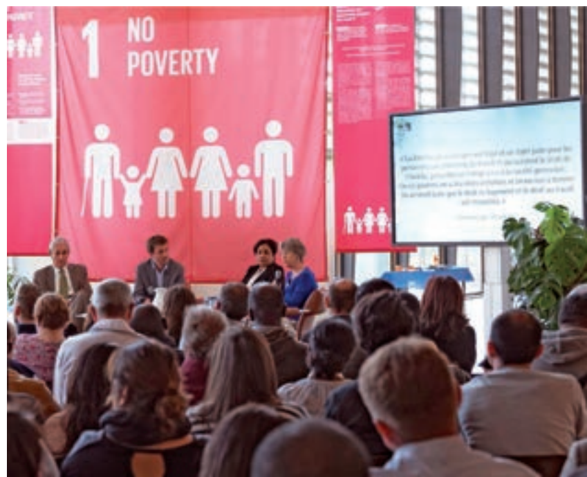
Commémoration du 17 octobre : Journée internationale pour l'élimination de la pauvreté, Genève

Après la commémoration, ils ont participé à un dialogue spécial sur les droits de l'homme, la participation et l'extrême pauvreté organisé par ATD en partenariat avec le Département des affaires économiques et sociales de l'ONU et le Haut-Commissariat des Nations Unies aux droits de l'homme (HCDH). Les participants ont souligné l'importance d'impliquer dans les politiques les personnes qui vivent dans la pauvreté, de construire des références communes sur les droits de l'homme, la participation et la dignité et ils ont exploré les possibilités de le faire dans le contexte des Nations Unies et de ses agences.