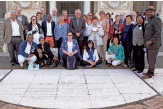
Rencontre Biennale du Comité international 17 octobre, Rome, du 15 au 17 mai 2018

Le Comité international 17 octobre* s'est réuni à Rome en mai et en a appelé aux Nations Unies pour mettre à jour son évaluation de 2006 de la célébration de la Journée internationale pour l'élimination de la pauvreté et également pour garantir que les personnes qui vivent dans l'extrême pauvreté participent effectivement et aient une voix aux Nations Unies. Il a également annoncé le thème de 2018 pour le 17 octobre : « S'unir avec les plus exclus pour construire un monde où les droits de l'homme et la dignité seront universellement respectés ».