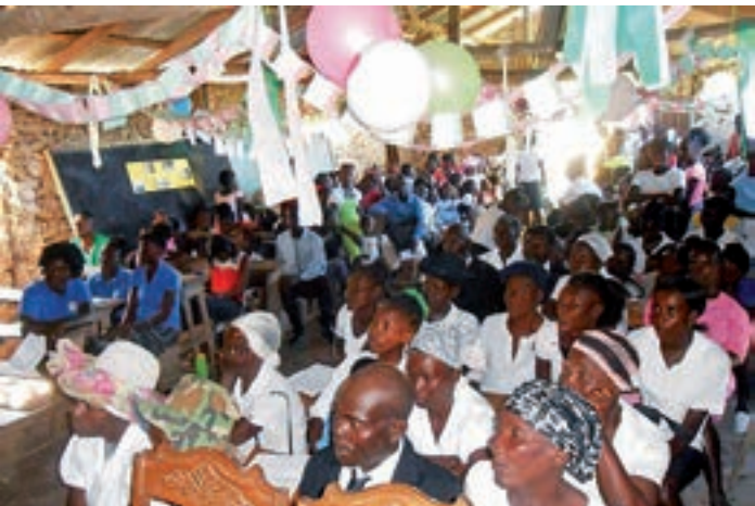
Commemoration du 17 octobre, Haïti

Île de la Réunion – ATD a renouvelé son partenariat (initié en 2017) avec l'Institut Régional du Travail Social (IRTS). Du 22 au 26 octobre, 9 militants ATD et un volontaire ont formé plus de 200 étudiants de l'Institut. Les futurs professionnels qui ont bénéficié de cette formation sont des étudiants de 1 ère et 2 ème année à l'IRTS, en plus d'un groupe de formateurs en ingénierie sociale. Cette occasion a enthousiasmé et déstabilisé à la fois les étudiants, les amenant à prendre conscience beaucoup plus concrètement des défis qu'ils auraient à relever pour être réellement au service des populations défavorisées.