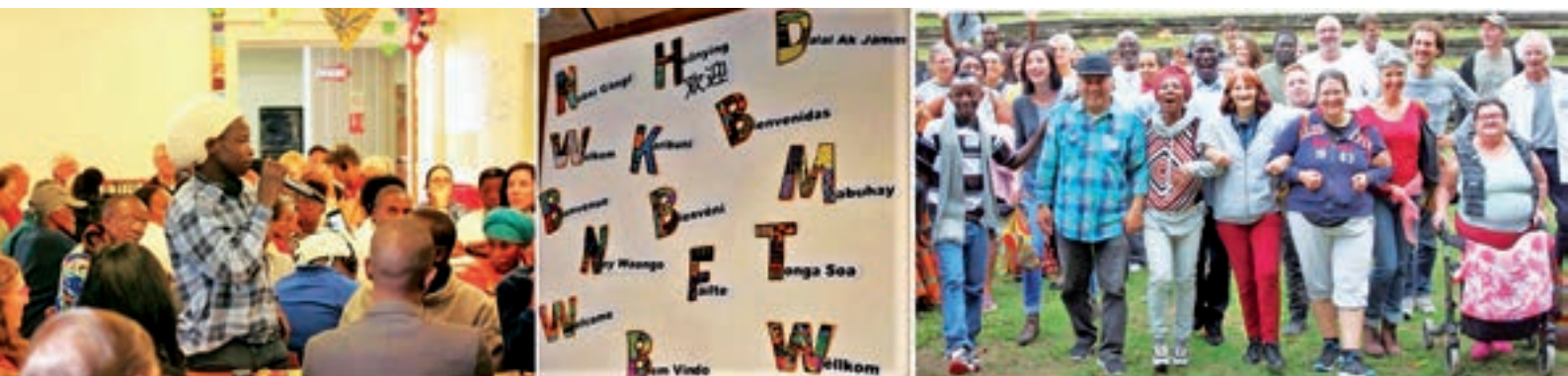
Regroupement mondial des membres d'ATD Quart Monde, du 10-17 octobre 2018, France

Île Maurice – Un événement historique a eu lieu le 13 octobre à l'Université de Maurice, rassemblant près de 200 personnes. Travailleurs sociaux, représentants d'ONG et fondations, étudiants de l'université, professeurs et universitaires, représentants du Ministère de la Sécurité Sociale et de l'Intégration Sociale, ainsi que des familles vivant dans la pauvreté se sont retrouvés pour partager leurs réflexions et connaissances de la pauvreté et de ce que sont les besoins fondamentaux. Lors de la conclusion, un universitaire a dit : « En 10 ans, le pays a changé, mais la vie des familles en pauvreté n'a pas changé. N'est-ce pas le signe que collectivement, nous avons failli? Il faut une remise en question... » Monsieur Cassam Uteem Président du Mouvement International ATD Quart Monde a insisté sur le fait que la lutte contre la pauvreté est une lutte pour que le respect des droits humains soit effectif et qu'il est indispensable de donner la parole aux pauvres.