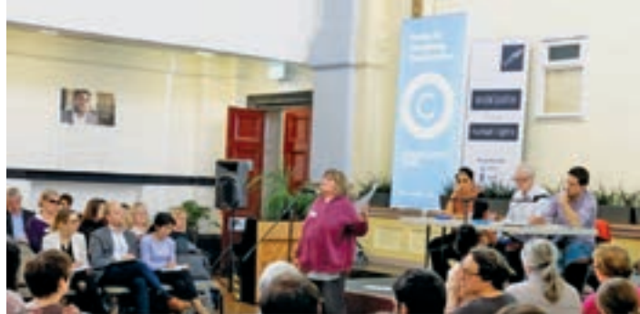
Le 12 novembre 2018, Londres : visite au Royaume-Uni du rapporteur spécial des Nations Unies sur l'extrême pauvreté et les droits de l'homme

Les équipes nationales d'ATD ont contribué à deux visites de pays par un Rapporteur spécial des Nations Unies :