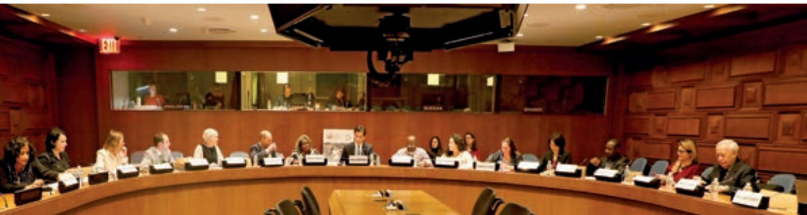
Journée internationale pour l'élimination de la pauvreté, 17 octobre 2018, Nations Unies New York

Joseph Wresinski était convaincu qu'éradiquer l'extrême pauvreté exige des politiques globales cohérentes à long terme, élaborées avec les personnes directement affectées. Maintenir un dialogue et construire des partenariats avec les organisations internationales sont des moyens importants pour contribuer à ce que l'extrême pauvreté demeure une de leurs priorités. Dans ce but, ATD Quart Monde a