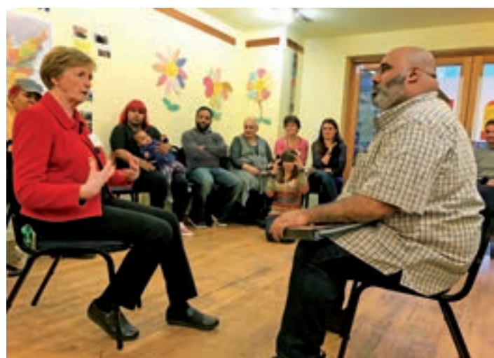
Université Populaire Quart Monde, décembre 2018, New York, États-Unis

El Alto, Bolivie – « Les lois ne sont pas faites pour ceux qui ont peu de moyens. » L'université populaire Quart Monde de ce mois-ci était focalisée sur les difficultés avec le système judiciaire que rencontrent beaucoup de familles boliviennes au quotidien. Avant la rencontre, des discussions préparatoires ont eu lieu sur les sujets suivants : corruption, diffamation, ainsi que les attitudes négatives et le manque de considération de la police et du système judiciaire en général. Plus de 40 participants et un avocat invité ont dialogué à propos des outils qui permettraient à la justice de mieux traiter les individus et de manière plus juste. La rencontre a encouragé les personnes à continuer de réfléchir sur ces sujets et à participer à des discussions qui aident les personnes à prendre conscience que leurs connaissances valent la peine d'être partagées, en particulier pour celles vivant en situation d'extrême pauvreté.