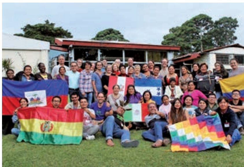
2 e Forum Joseph Wresinski : pauvreté et droits humains en Amérique Latine et Caraïbes, octobre 2018