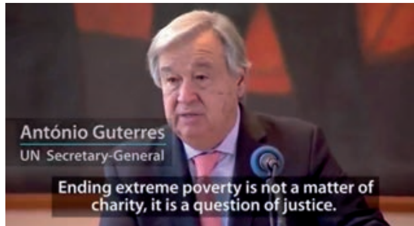
Le Secrétaire Général des Nations Unies, António Guterres, commémoration du 17 octobre, New York

Après la commémoration, ils ont participé à un dialogue spécial sur les droits de l'homme, la participation et l'extrême pauvreté organisé par ATD en partenariat avec le Département des affaires économiques et sociales de l'ONU et le Haut-Commissariat des Nations Unies aux droits de l'homme (HCDH). Les participants ont souligné l'importance d'impliquer dans les politiques les personnes qui vivent dans la pauvreté, de construire des références communes sur les droits de l'homme, la participation et la dignité et ils ont exploré les possibilités de le faire dans le contexte des Nations Unies et de ses agences.