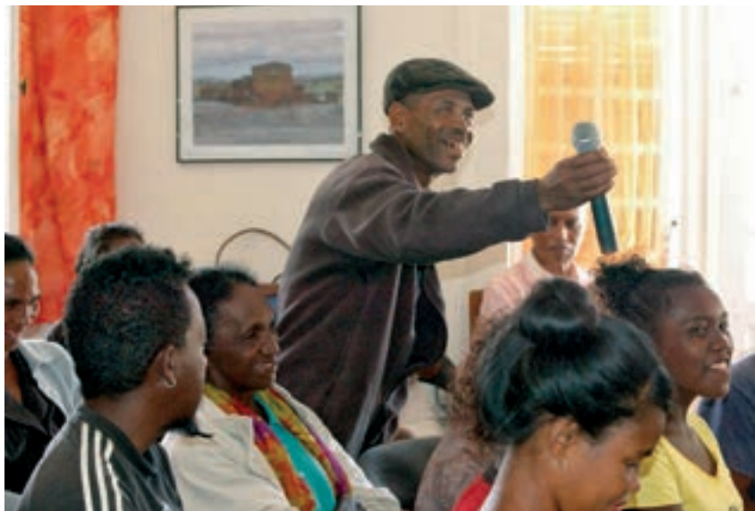
Université Populaire Quart Monde, janvier 2018, Madagascar

Centre International – Les jeunes engagés dans la lutte contre la pauvreté ont participé à un séminaire de formation du 13 au 17 Janvier. Les 40 participants de différents pays européens ont partagé expériences et leçons apprises lors de projets avec des jeunes, afin de trouver des méthodes efficaces de mener des activités dans lesquelles ceux-ci peuvent participer. Le Théâtre-forum est apparu comme un des outils de référence d'ATD dans la motivation des jeunes à travailler pour une société plus juste. Cette méthode aide les jeunes à prendre du recul sur des situations difficiles qu'ils ont vécues et à trouver des solutions ensemble avec le public.