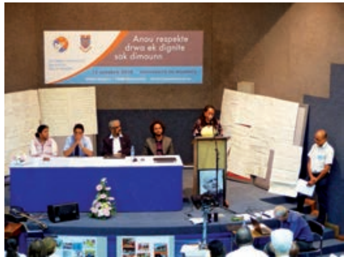
Commémoration du 17 octobre à l'Université de Maurice, le 13 octobre 2018

Île Maurice – Un événement historique a eu lieu le 13 octobre à l'Université de Maurice, rassemblant près de 200 personnes. Travailleurs sociaux, représentants d'ONG et fondations, étudiants de l'université, professeurs et universitaires, représentants du Ministère de la Sécurité Sociale et de l'Intégration Sociale, ainsi que des familles vivant dans la pauvreté se sont retrouvés pour partager leurs réflexions et connaissances de la pauvreté et de ce que sont les besoins fondamentaux. Lors de la conclusion, un universitaire a dit : « En 10 ans, le pays a changé, mais la vie des familles en pauvreté n'a pas changé. N'est-ce pas le signe que collectivement, nous avons failli? Il faut une remise en question... » Monsieur Cassam Uteem Président du Mouvement International ATD Quart Monde a insisté sur le fait que la lutte contre la pauvreté est une lutte pour que le respect des droits humains soit effectif et qu'il est indispensable de donner la parole aux pauvres.