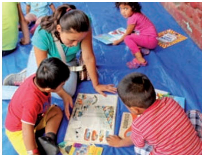
Au Centre Européen de la Jeunesse, Budapest, Hongrie, juillet 2018

Tout le trésor de connaissances partagé et accumulé lors de ce séminaire et les deux années de dialogue qui en ont débouché sera partagé au moyen d'un livre et d'une vidéo ; cela servira également à enrichir le plaidoyer d'ATD auprès des institutions internationales, ainsi que son travail avec la communauté de la recherche sur l'éducation.